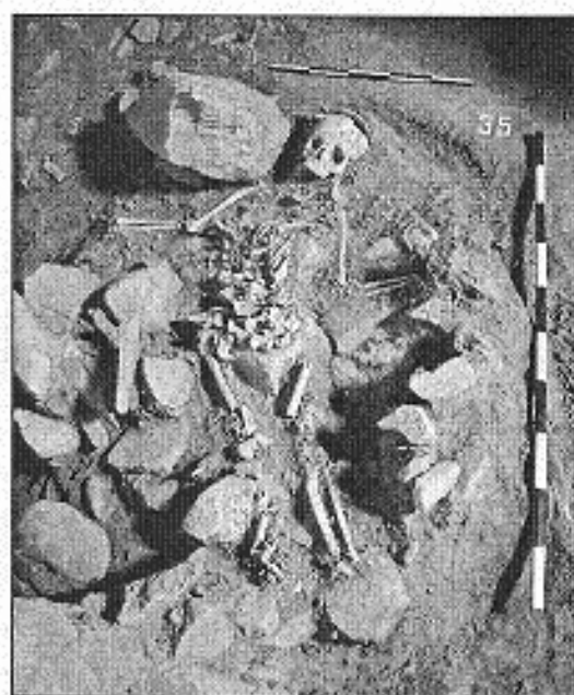
Обр. 3. Гроб №35, в олтарното пространство на средновековната църква

3. Находки. По време на разкопките бяха придобити 58 находки, сред които 7 монети, железни гвоздеи, бронзови гривни, пръстени, две култови фигурки от РЖЕ, две костени игли. Монетите и останалите находки потвърждават датировките за съществуването на култовия комплекс на това място от края на ранно-желязната епоха до началото на XV в., когато е изградена последната сграда на това място - мюсюлманския храм.