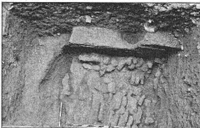
Обр. 1. Пещ за строителна керамика, северно от западното преддверие на джамията

1. А. На 0.60 м под подовото ниво и под основите на църквата бяха открити останки от две сгради с правоъгълна форма, ориентирани точно по посоките на света. По-малката сграда попада в централната част на наоса и е вписана в по-голямата, чиито останки бяха разкрити южно от южния зид на църквата. И двете сгради са изградени от камъни със спойка от бял хоросан, а основите са вкопани в здравия