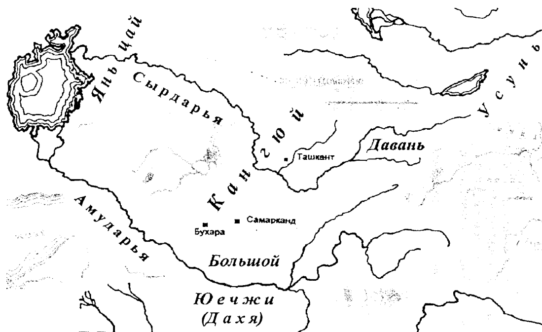
рис. 2. Владения Западного края в эпоху Хань