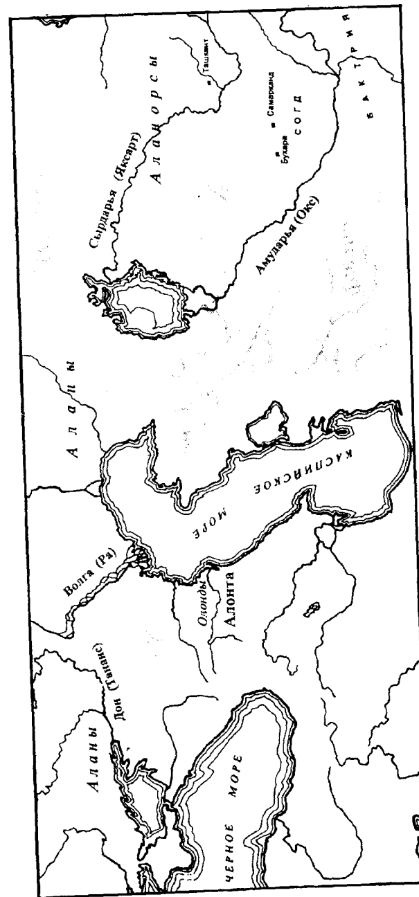
рис. 1. Расселение алан по Птолемее

МТВ - Memoirs of the Research Department of the Toyo Bunko