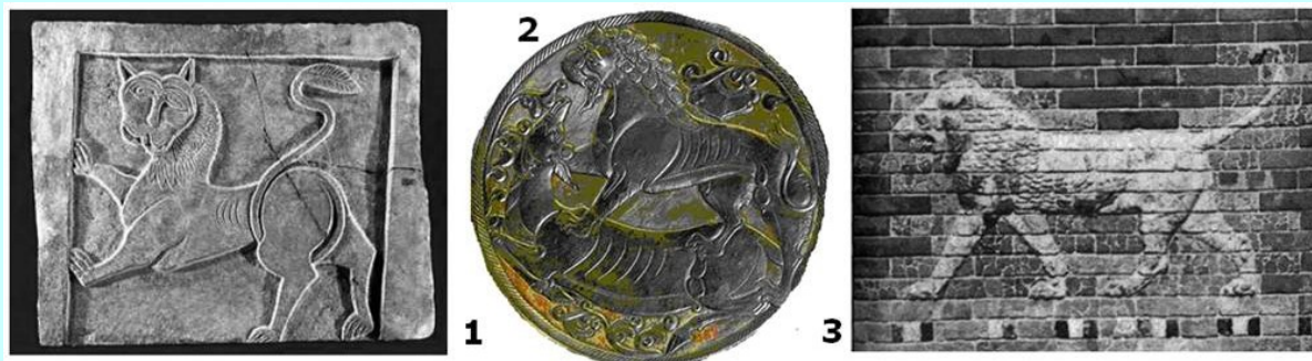
Obr. 1 Vyobrazení (1) ohřivený leopard na kamenné desce ze Stare Zagory (9. st.) (2) ohřivený bars na podnose z místa Bolšaja Anikovskaja, město Perm (Volžské Bulharsko, 7. – 8. st.) a (3) lev na stěně brana I štar, město Babylon (rok 575 p.n.l.)

horské údolí Σιδηρά (Σιδηρά - Sidera) –západní hranici Tervelovi oblasti Zagora (Zlatarski, 1934, str. 167-187; Petrov, Gjuzeev, 1978, str. 400-413; Rajna Kjaginja, Autobiografie, str. 79; Poije, 2005, str. 337-356; Voaleri, 2005, str. 345; Ivanov, 2010)