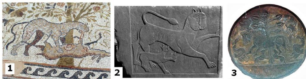
Obr. 2 Zobrazení (1) panter na raně byzantske mozaice z města Heraclea Lyncestis (4.-5. st.), (2) krmici bars na kamenne desce ze Stare Zagory (9.st.) a krmici bars na stříbrnych podnosech z udoli řeky Kama, Volžske Bulharsko (8.-9.st.) (Smirnov, 1909; Kyzlasov, 1994, str. 267-268). Na prvni obrázku je zachovana perspektiva na druhe a třetím je vědomě narušena perspektiva typicka pro prabulharske vytvarne umění.

s prvním desetiletím pokřtění Bulharska a velkou vystavbou kostelů a klášterů v době knížete Borise (Gjuzelev, 1969, str. 147). Podle autora to byl sam kníže Boris, který dal stavět v Beroe katedrál ní chram a klášterní budovy kolem něho. To mohou být i vyše uvedene nalezy klášterů v okolí starozagorskeho Ajazma.