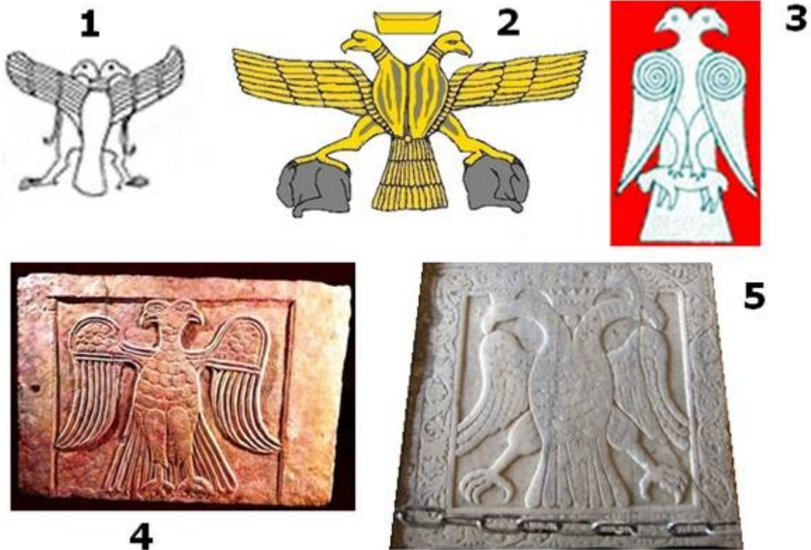
Obr. 4 Zobrazení dvouhlavého orla (1) Sumer a Akad (3800 let p.n.l.), (2) Chetitská říše (1900-1250 let p.n.l.), (3) erb arménské dynastie Mamikjanů (v letech 330-772), (4) kamenná deska ze Staré Zagory (9.stol.), (5) erb panovníka Michaila VIII. (r. 1224-1282) zakladatel dynastie Paleologů.