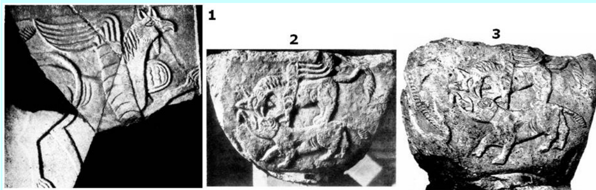
Obr. 3 Stejně vyobrazení grifona (1) na kamenné desce ze Stare Zagory (9. st.), (2) svatyně z Nove Zagory (?) a (3) svatyně z místa Novy Pazar (9. st.).

tohoto druhu zvířete poskytují vyobrazení na stříbrných podnosech z Volžsko-Kamského Bulharska obr. 1 a 2. Podle V. Beševlieva (Beševliev, 1979, str. 227-229) nejcharakterističtější zvláštnosti příkaspického barse je vyskyt malé hřivy koňského typu – osrstění v zadní části krku, podobné koňské hřivě u koni. Takovou hřivu mají barsove ze starozagorských reliefů a podnosy z Volžského Bulharska (obr. 1 a 2). Podle V. Beševlieva právě tato barsova zvláštnost může vysvětlit vychozí iranske označení tohoto zvířete, protože v iranských jazycích „bars“ znamená „hřiva“. V osetinštině a talištině „barc“ znamená „ohřivený“, což vychází ze staroiranského a sankritského slova vrcha – hřiva (Dobrev, Dobрева, 2001, str. 108).