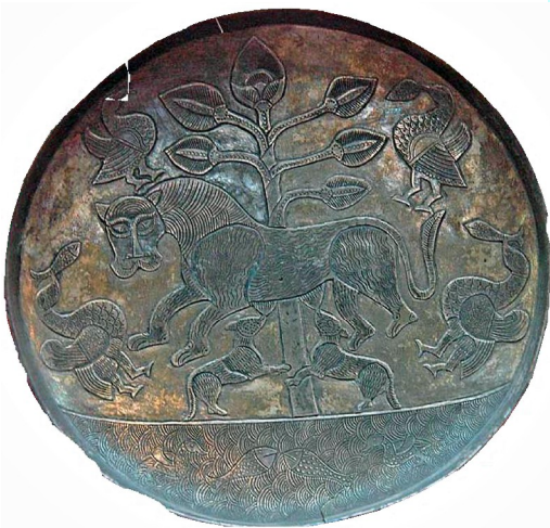
Obr. 2 Ohřiveni barsove